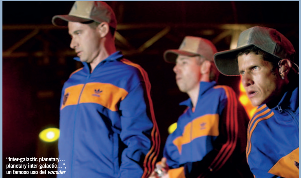
"Inter-galactic planetary... planetary inter-galactic...", un famoso uso del vocoder

El vocoder permanecerá entre nosotros mientras los franceses sigan entrando a los estudios de grabación. Este efecto permite realizar una mezcla de voces con sonidos sintéticos para crear las fabulosas voces robóticas de Intergalactic (Beastie Boys) o coros más etéreos y sutiles.