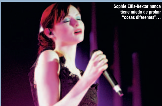
Sophie Ellis-Bextor nunca tiene miedo de probar "cosas diferentes"...

Hay muchos compositores y cantantes especializados en crear letras y melodías de acompañamiento. De hecho, así es como surgió la colaboración de Spiller con Sophie Ellis-Bextor que dio lugar a Groovejet –el tema de fondo llevaba mucho tiempo por ahí. Desarrollarás tus habilidades si colaboras con un especialista en voces, y te obligarás a producir algo distinto de lo que estás habituado.